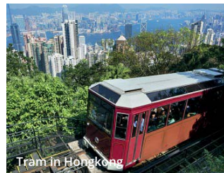
Tram in Hongkong

Neicheiner Heide 18 • 53604 Bad Honnef Telefon: (02224) 98 98 98 • Fax: (02224) 98 98 94 info@rdb-reisen.de • www.rdb-reisen.de