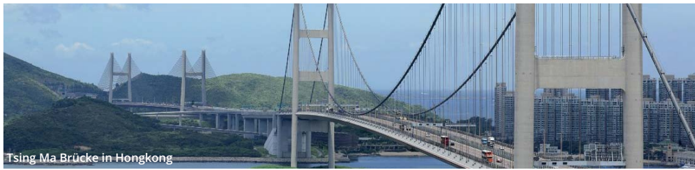
Tsing Ma Brücke in Hongkong