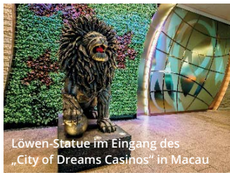
Löwen-Statue im Eingang des „City of Dreams Casinos“ in Macao