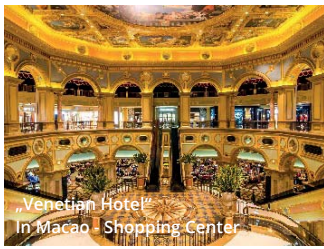
„Venetian Hotel“ In Macao - Shopping Center