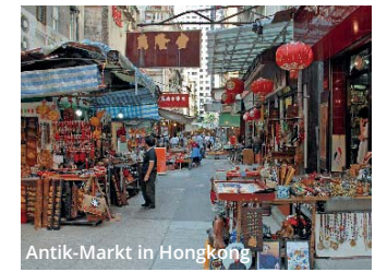
Antik-Markt in Hongkong