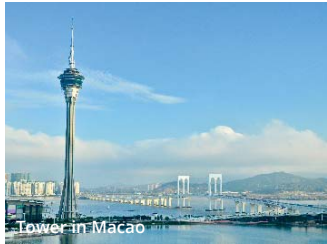
Tower in Macao