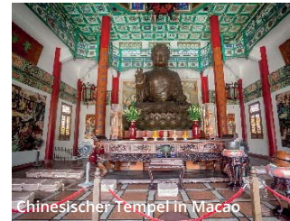
Chinesischer Tempel in Macao