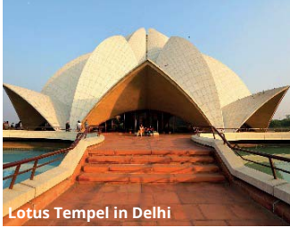
Lotus Tempel in Delhi