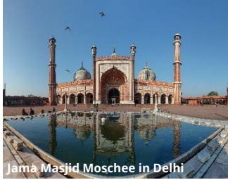
Jama Masjid Moschee in Delhi