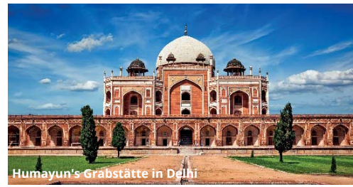
Humayun's Grabstätte in Delhi