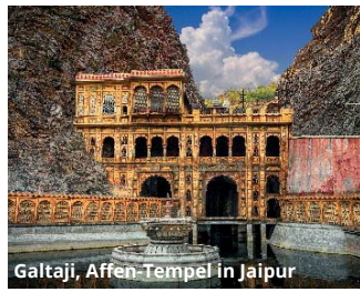
Galtaji, Affen-Tempel in Jaipur