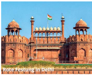
Rote Festung in Delhi