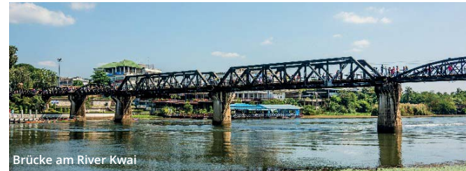
Brücke am River Kwai

Im Historischen Park besichtigen Sie Relikte der alten Palast- und Tempelstadt. Weiterfahrt nach Lampang. Das im burmesischen Stil gehaltene Kloster Lampang Luang ist beispielhaft für die nordthailändische Architektur. Ein weiteres bedeutendes Baudenkmal ist das interessante Kloster Wat Phra Keo Don Tao, in dem früher der berühmte Smaragd- Buddha, das größte Heiligtum Thailands, aufbewahrt wurde.