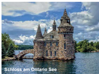
Schloss am Ontario See

Der heutige Vormittag ist der Stadtbesichtigung Ottawas gewidmet. Die Hauptstadt Kanadas beeindruckt ihre Besucher! Auf dem Parliament Hill glaubt man im alten Europa zu sein. Weitere Höhepunkte der Rundfahrt sind das neugotische Parlamentsgebäude und der Rideau Kanal, der