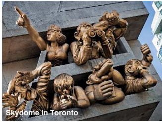
Skydome in Toronto