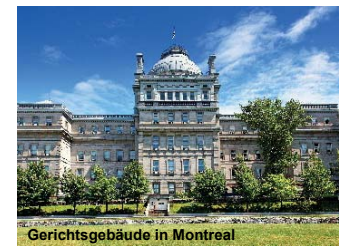
Gerichtsbau in Montreal