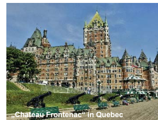
„Chateau Frontenac“ in Quebec