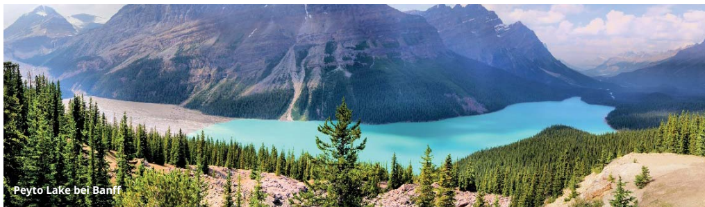
Peyto Lake bei Banff

Es gelten die Allgemeinen Reisebedingungen des Reiseveranstalters.