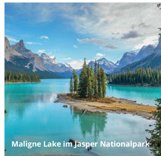
Maligne Lake im Jasper Nationalpark