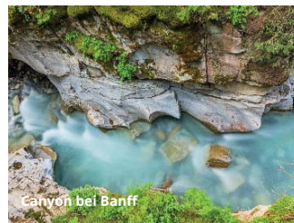
Canyon bei Banff