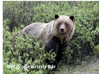
Der große Grizzly Bär