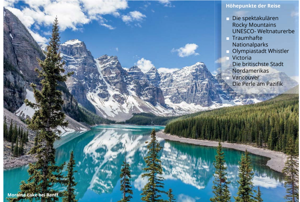
Moraine Lake bei Banff