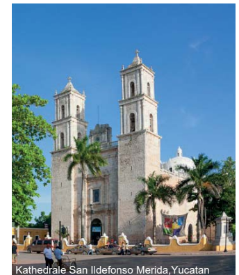
Kathedrale San Ildefonso Mérida, Yucatan