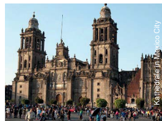
Kathedrale in Mexico City

An ihm stehen die Kathedrale, an deren Fassade sich der Wandel von der Renaissance über Manierismus und Barock zum Klassizismus zeigt, und der „Palacio Nacional“. Im Innenhof besichtigen Sie die berühmten Wandfresken des mexikanischen Künstlers Diego Rivera. Gegen Mittag verlassen Sie Mexiko-Stadt in südlicher Richtung. Ihr heutiges Ziel ist das Bergdorf Tepoztlán. Ein gemeinsames Abendessen rundet den heutigen Tag ab.