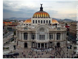
Palacio de Bellas Artes, Mexico City

Jaguar-Palast geben dem Besucher ein Bild von der Pracht und dem Zauber einer Kultur, die schon lange Vergangenheit ist.