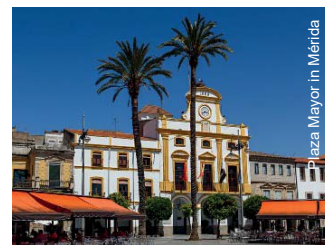
Plaza Mayor in Mérida