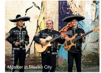
Musiker in Mexico City

Der Vormittag steht Ihnen noch zur freien Verfügung. Gegen Mittag Transfer zum Flughafen nach Cancun